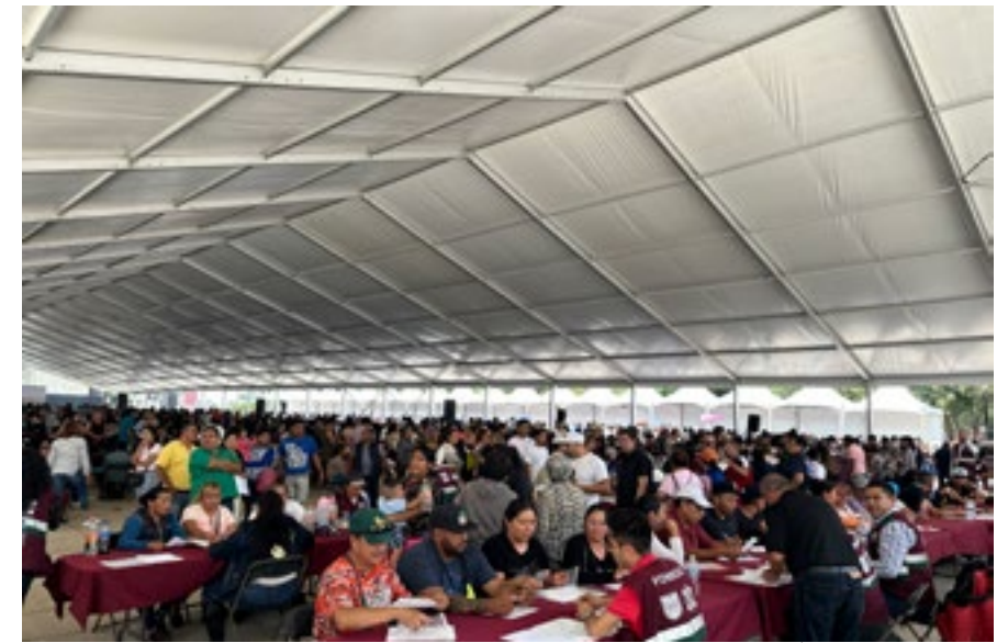
ENTREGA DE CRÉDITOS, FONDESO