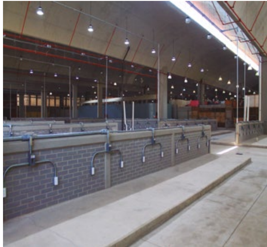
MERCADO DE LA MERCED