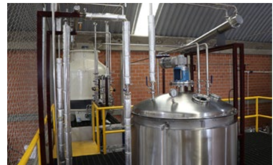
PLANTA PILOTO DE BIODIÉSEL

En 2022, una vez concluido el periodo de pruebas en "Metrobús", cinco de las empresas concesionarias adquirieron 21,263 litros del bioaditivo para su uso en mezcla con diésel. En el periodo enero julio de 2023 se han surtido 7,720 litros de bioaditivo a Metrobús. En el periodo comprendido entre