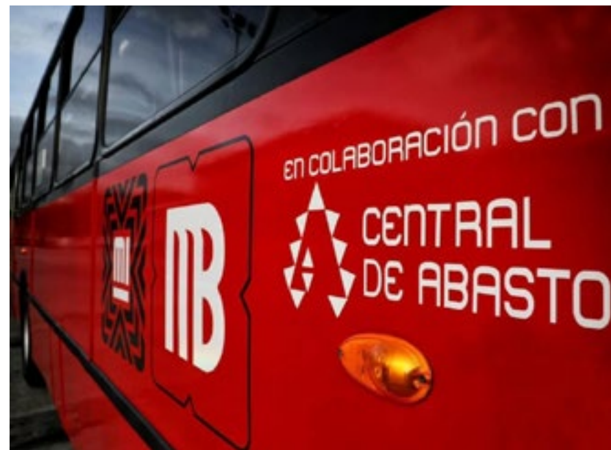
USO DE BIODIÉSEL EN METROBÚS

En octubre de 2022, inició la etapa denominada arranque y estabilización, que consistió en el llenado del biodigestor, el enriquecimiento del medio mediante adición de nutrientes, el establecimiento de dinámicas operativas, muestreos, análisis en laboratorio y el control y monitoreo diario de parámetros en sitio, lo que permitió determinar las necesidades operativas del biodigestor y establecer procedimientos de ajuste. A mediados de mayo de 2023, se iniciará con la producción del biofertilizante.