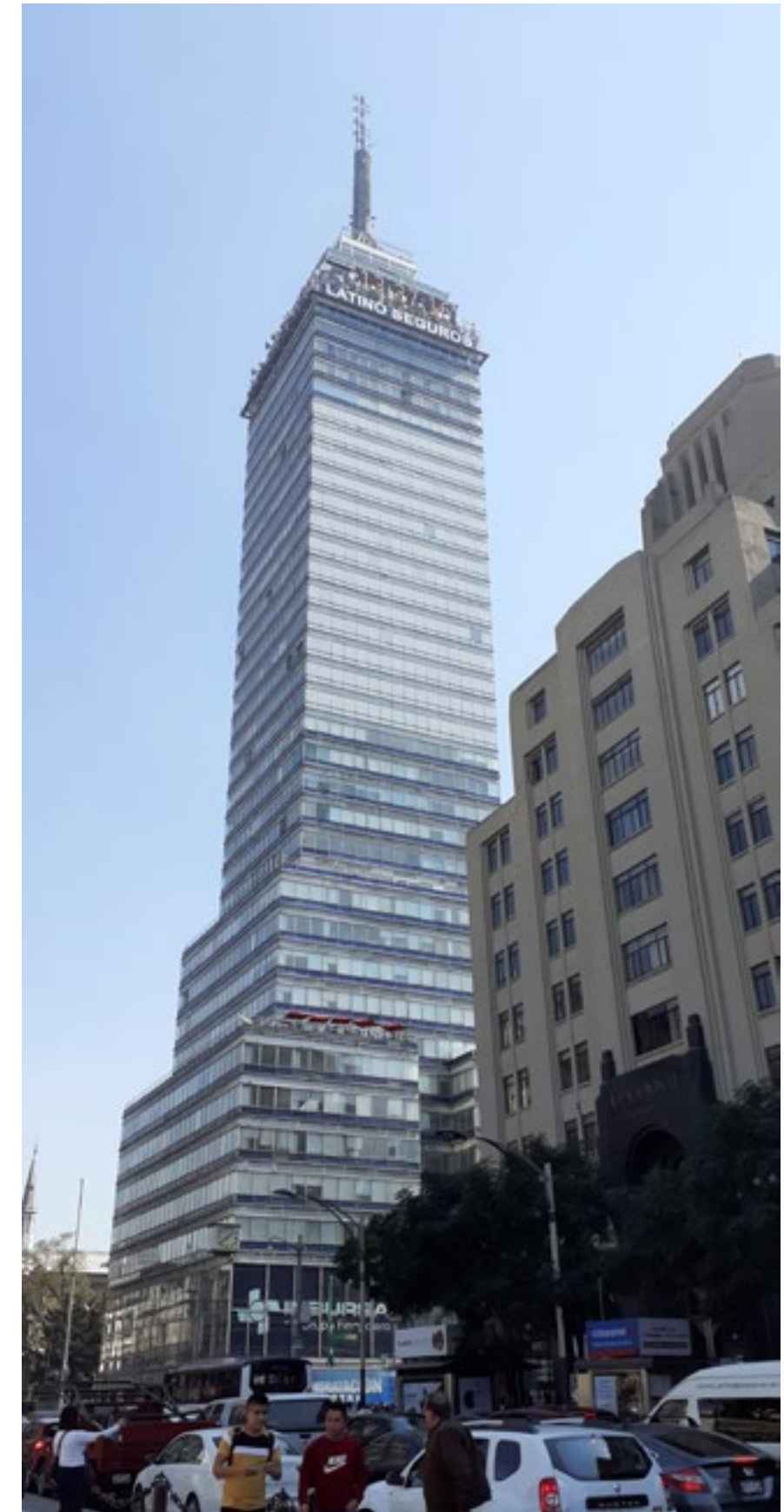
TORRE LATINOAMERICANA, CDMX

Desde el Gobierno de la Ciudad de México, mantenemos el compromiso de continuar impulsando la reactivación de la economía.