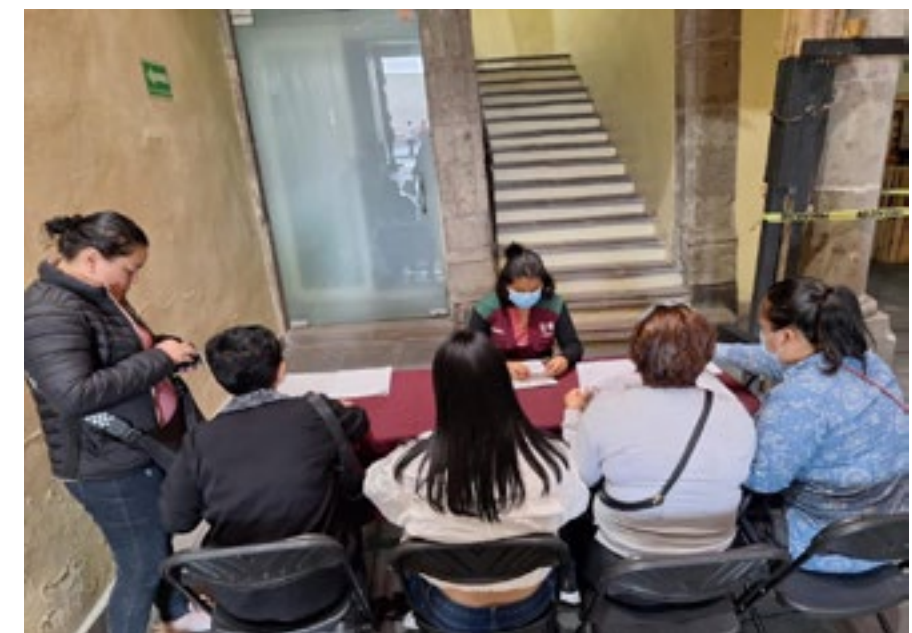
CAPACITACIONES DE FONDESO

Con el propósito de fortalecer la capacidad de generar ingresos y empleos de las Mipymes, mejorar su competitividad y elevar sus niveles de productividad, e incidir en los factores que determinan su permanencia y estabilidad en la economía de la Ciudad, se han desarrollado estrategias y acciones a través del Centro de Promoción a la Inversión de la Secretaría de Desarrollo Económico y del Fondo para el Desarrollo Social de la Ciudad de México.