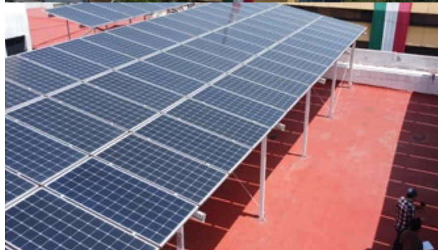
PANELES FOTOVOLTAICOS DE SEDECO