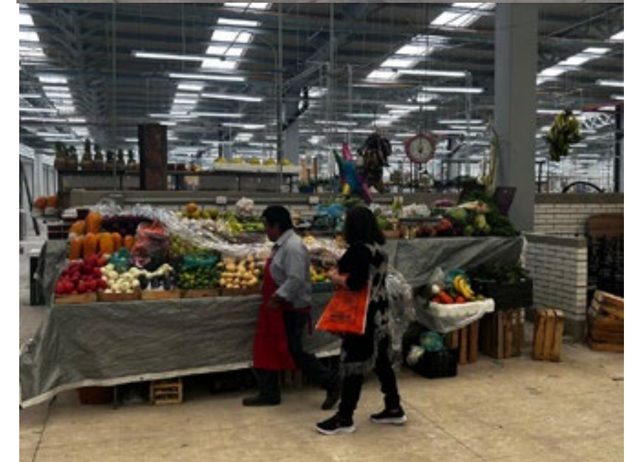
MERCADO SAN COSME