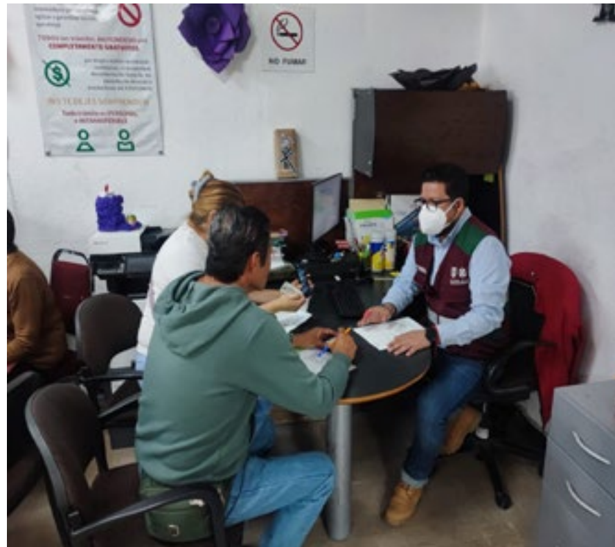
ATENCIÓN A USUARIOS

Las soluciones y herramientas tecnológicas para obtener esta información con estudios de mercado que ofrecen las empresas consultoras son costosas. El Gobierno de la Ciudad pone a disposición de los emprendedores los servicios de la Oficina Virtual de Información Económica (OVIE); un medio interactivo, de fácil acceso y manejo, al alcance de las empresas de menor tamaño y de las personas interesadas en desarrollar una actividad económica. A través de la OVIE se brindan asesorías presenciales y en línea para identificar oportunidades de negocio, nichos de mercado, competencia y vinculación con proveedores. En los cinco años de gobierno se atendieron 176,908 consultas en línea de emprendedores y micro, pequeños y medianos empresarios.